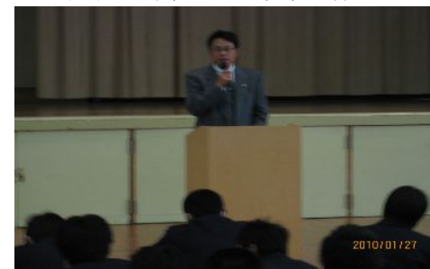
真剣な表情で説明を聞いていました。