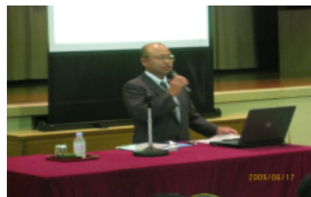
専修大学の講演会